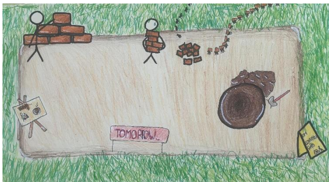
“Edificar o Amanhã” – tema em construção, interpretação de algumas alunas do Colégio.

O tema que nos guia neste ano letivo — “Edificar o Amanhã” — recorda-nos que o futuro é sobretudo resultado das escolhas, dos gestos e do empenho que colocamos no presente. É no cuidado diário, na responsabilidade partilhada e na aprendizagem contínua que encontramos a solidez necessária para construir um futuro promissor e feliz.